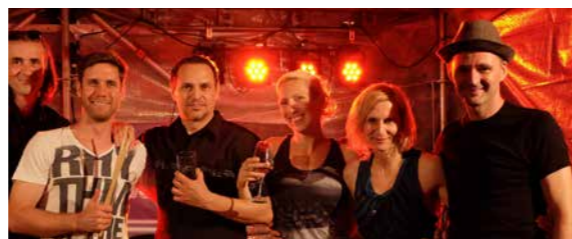
SCHULHOF 19:00–24:00 UHR CHIC TIMES