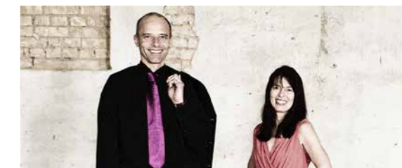
SCHULHOF 18:00–23:00 UHR SUGAR 2 BEAT