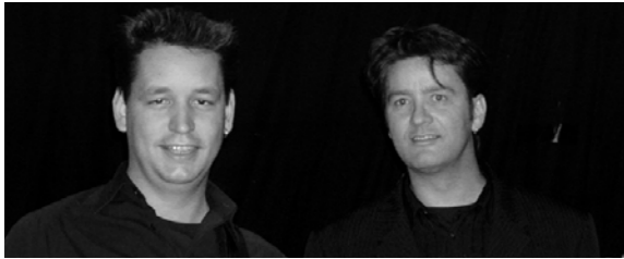
RATHAUS 19:30–23:30 UHR DUO TABOO

18:00 Uhr Öffnung der Weinstände und Höfe 19:30 Uhr Festausklang mit Bühnenprogramm