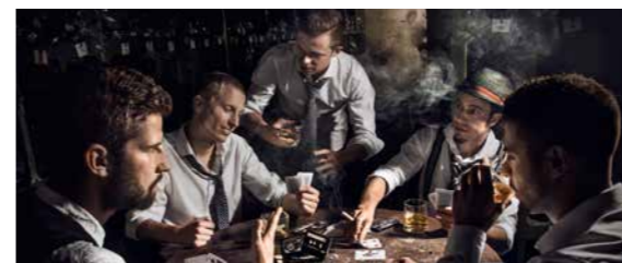
RATHAUS 19:00–24:00 UHR TSCHAU JOHNNY