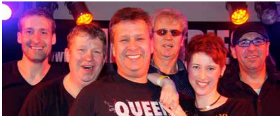
SCHULHOF 19:30–23:30 UHR THE CANDIES

V.i.S.d.P.: Heimat- und Verkehrsverein Nackenheim e.V. 55299 Nackenheim | HVV-Nackenheim.de