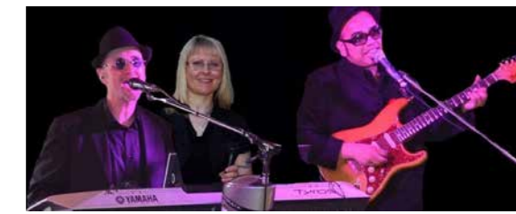
RATHAUS 18:00–23:00 UHR VIS A VIS